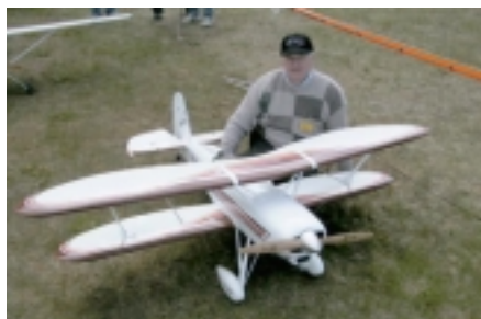
Starduster - Birgir Sigurðsson