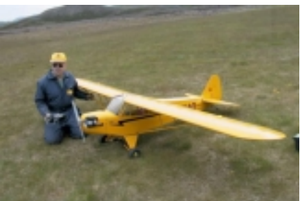
Piper Cup 1/3 - Skjöldur Sigurðsson