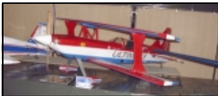
Fallegur og vel smíðaður Ultimate frá Skyldi Sigurðssyni

40 bensínmótorum og vænghaf upp á 3.60 metra. Í öðru sæti varð falleg Citabria í ¼ skala í eigu Gunnars Jóns-