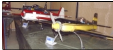
Tvær fallegar Sukhoi vélar.

Sumir voru vantrúaðir á aðsókn þar sem greiða þurfti fyrir aðgang, en sýningin skilaði þökkalegum hagnaði.