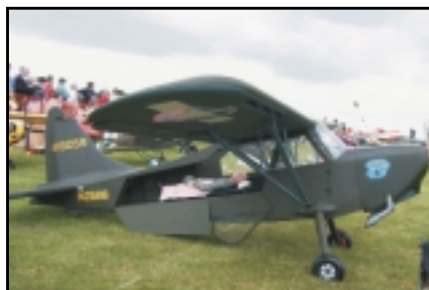
Sjúkraflugvél sem notuð var til að flytja særða hermenn í stríði.