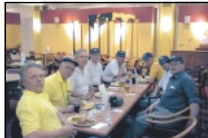
Það var mikið skálað og margar ræður fluttar við síðustu kvöldmáltíðina.

sagðist þurfa að sinna smáverkefni. Stuttu síðar heyrðust hláturssköll því inn í tjaldið kom fánaberi með fána LMA og á eftir honum kom stjórnarformaðurinn í gerfi páfa. Gengu þeir á svið og upphófu