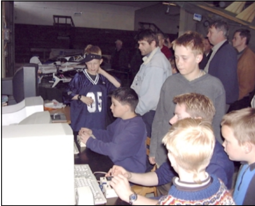
Vinsælasti staðurinn á flugmódeleysýningunni var að sjálfsögðu við flughermana.

Flugmódelefélagið Þyur, Flugmódelefélag Suðurnesja og Flugmódelefélag Akureyrar tóku ákvörðun um að standa sameiginlega að flugmódeleysýningu á árinu 1999. Þar átti að vera með ný módel, módel í smíðum og notuð módel af öllum gerðum og stærðum. Einnig að hafa smíðaherbergi þar sem unnið væri að smíði flugmódele, flugherma þar sem hægt væri að prófa að fljúga flugmódeli, lifandi myndasýningar frá módeleflugi vítt