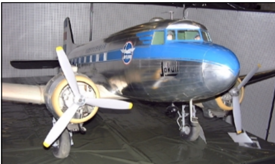
Douglas C 47 - 1. sæti yfir besta flugmódelelið

starfsemi sýna. Tilgangurinn með sýningunni væri að kynna þetta skemmtilega sport fyrir almenningi og markmiðið að fjölga verulega nýjum aðilum með fjarstýrð flugmódel á næstu árum.