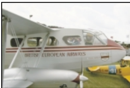
Þessi De Haviland Rabide var í nokkur ár í farþegaflugi hér á landi.

innan LMA. Var greinilegt að menn voru hrifnir af þessu framtaki okkar að mæta á sýningu. Við fengum að vera viðstaddir samsetningu á B-17 fjögurra hreyfla fljúgandi virki sem er um sjö metrar í vænghaf. Það var ótrúlegt að sjá hvað þessi vél var vel smíðuð og vel gengið frá öllum búnaði í henni. Á laugardeginum sáum við svo þessa gríðarlegu stóru vél fljúga í samflugi með þremur öðrum jafnstórum vélum af sömu gerð. Einhvern hafði líklega dreymt um að sjá eina svona vél fljúga, en fjórar saman í lágflugi var ótrúlegt að sjá. Hljóðið í 16 stórum bensínmótörum, þessi ógnvænlega stærð vélanna og fjöldi, gerði þessa