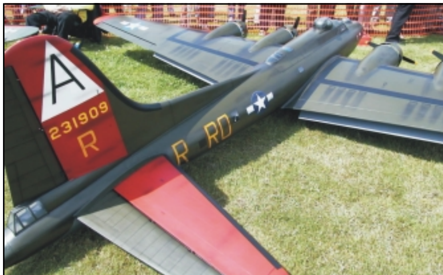
Hér sjáum við eina af fjórum B-17 fljúgandi virki sem flugu samflug báða sýningardagana. Þessi vél er með vænghaf hátt í sjö metra.

í loftinu 12 vélar, allar úr fyrri heimstyrjöldinni. Það var sem ský drægi fyrir sólu þegar þær geystust um loftið.