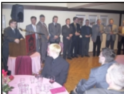
10 aðilar sérstaka fengu viðurkenningu.