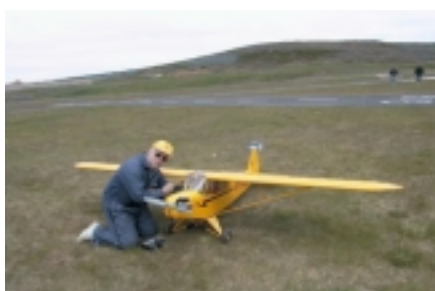
Piper Cup 1/3 - Skjöldur Sigurðsson