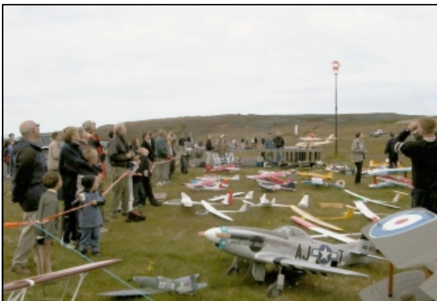
Hér sést hluti af þeim mikla fjöldi flugmódel sem var til sýnis.

Þegar litið er til þess að um 60 módel voru á staðnum og um þriðjungur af þeim stærri vélar, glæsilegar aðstöðu á Hamranesi og sex klukkutíma flugsýningar má setja flugmódelfélagið Þyt við hliðina á stærstu og virkustu flugmódelklúbbum í Evrópu. Félagsmenn geta verið stoltir af þessari glæsilegu 30 ára afmælisflughátíð og framkvæmdanefndarmenn með Böðvar Guðmundsson fremstan í flokki eiga mikið og gott hrós skilið.