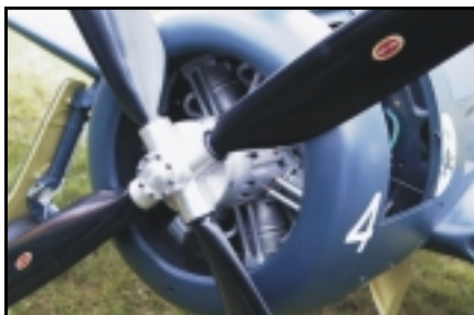
Þessi Beercat er með 14 strokka heimasmiðaðan stjórnunmótör og skiptiskrúfu.

Áður en við fórum af svæðinu var eigandinn af Glenn models að fljúga nýrri