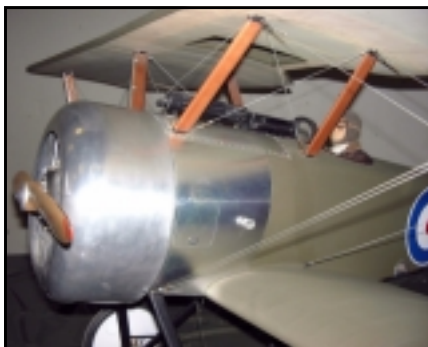
Fallegt handbragð sem Skjöldur Sigurðsson ber ábyrgð á.

Þegar upp var staðið bárust um 50 flugmóðel, flest fullkláruð og nokkur sem voru í smíðum. Því miður barst ekkert flugmóðel frá Flugmóðelfélagi Akureyrar og má líklega um kenna fjarlægð og