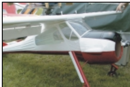
Ekki er vitað um nafn á þessari, en hún er mjög sérstök í útliti.