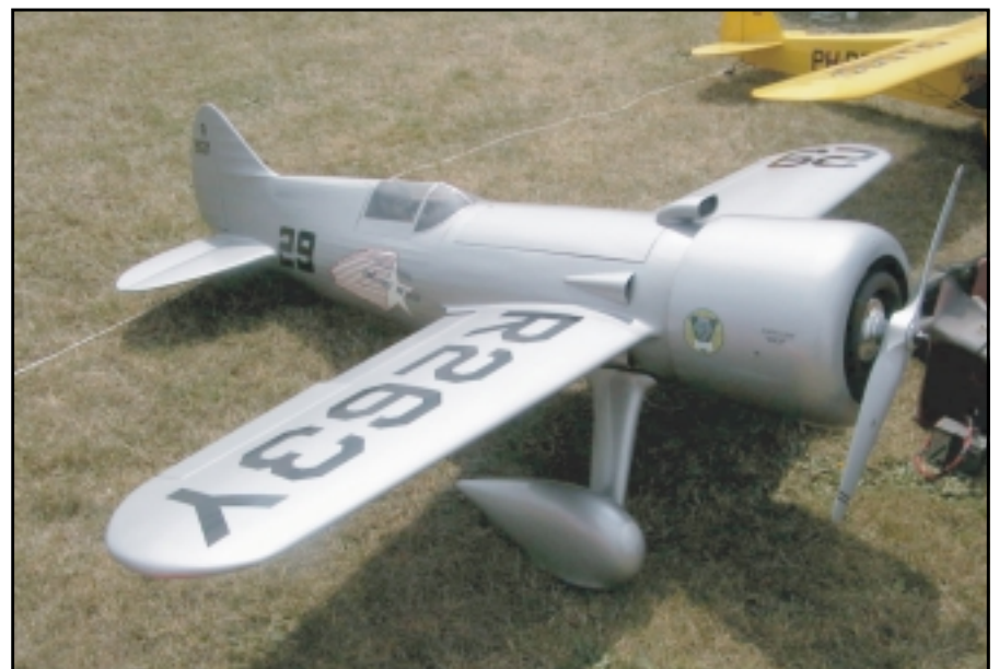
Þessi hefur líklega einhverntíman sett hraðamet í flugi.