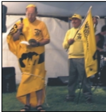
Stjórnarformaðurinn lék á alls oddi í lokahófi LMA á laugardagskvöldinu.

Á laugardagsmorgninum fórum við af stað út á sýningarsvæði kl. 10:30 og er við komum þangað átti aðgangseyririnn að vera 7 pund á mann, en þar sem "the Icelandic group" var á ferðinn borguðum við bara 5 pund á mann. Allt var á fullu á svæðinu þegar við komum, einar fimm vélar í loftinu og mörg móteli höfðu bæst við á rampinn frá því deginum áður. Segja má að þessi dagur hafi verið alsæla fyrir