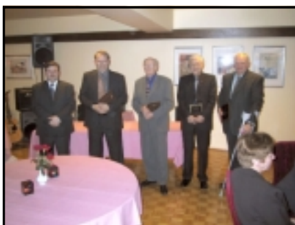
Fjórir heiðursfélagar ásamt formanni.

voru fjórir nýir heiðursfélagar heiðraðir og margir félagar sem tekið hafa þátt í 30 ára starfi félagsins fengu viðurkenn-