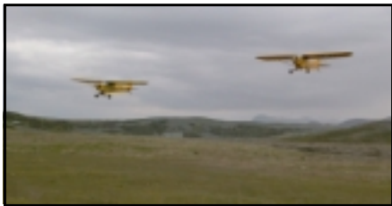
Tvær Piper Cup vélar, önnur í fullri stærð og hin í 1/3 stærð.

Mikill fjöldi flugmódelar barst á staðinn til sýningar og sumir voru með ótrúlegan