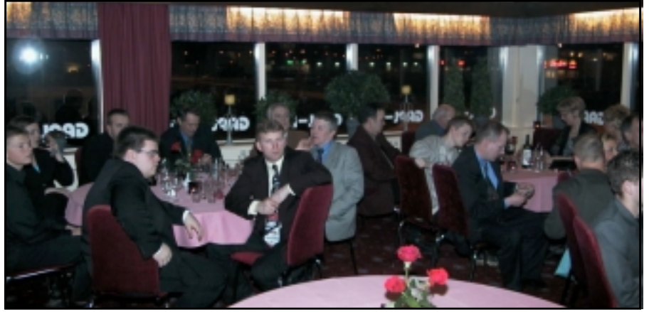
Flugmódelmenn af Suðurnesjum mættu líka á afmælisfagnaðinn.

Afmælisfagnaðurinn þótti takast með afbrigðum vel og mættu yfir 50 manns og nutu þess að taka þátt í skemmtilegri kvöldstund. Hljómsveitin Balsabandið var aðalskemmtiatriði kvöldsins, en meirihluti hennar situr í stjórn félagsins og allir eru þeir virkir módelmenn. Einnig sungu tvær klassískar söngkonur nokkur lög og þóttu þær setja svip á kvöldið.