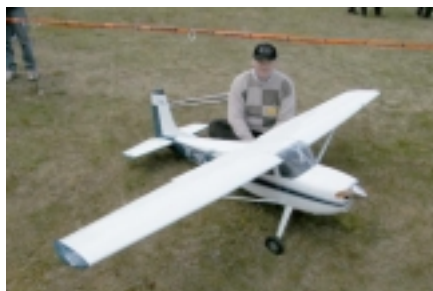
Cessna 180 - Birgir Sigurðsson