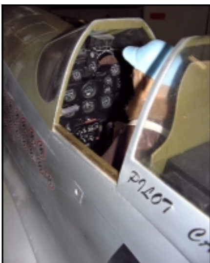
Margar vélar voru hreint ótrúlegar í smátriðum eins og sést vel á mælaborðinu í þessum Mustang P51.

fljúga í flughermum og þar gat “ungt” áhugafólk prófað að fljúga flugmóðeli í