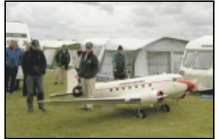
Douglas DC3 í 1/4 stærð