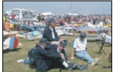
Slappað af í góða veðrinu.