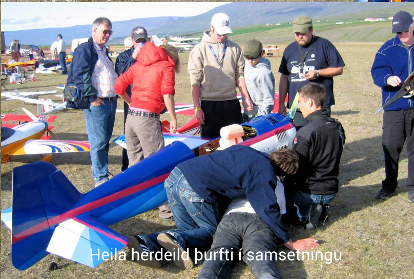
Heila hærdeild þurfti í samsetningu