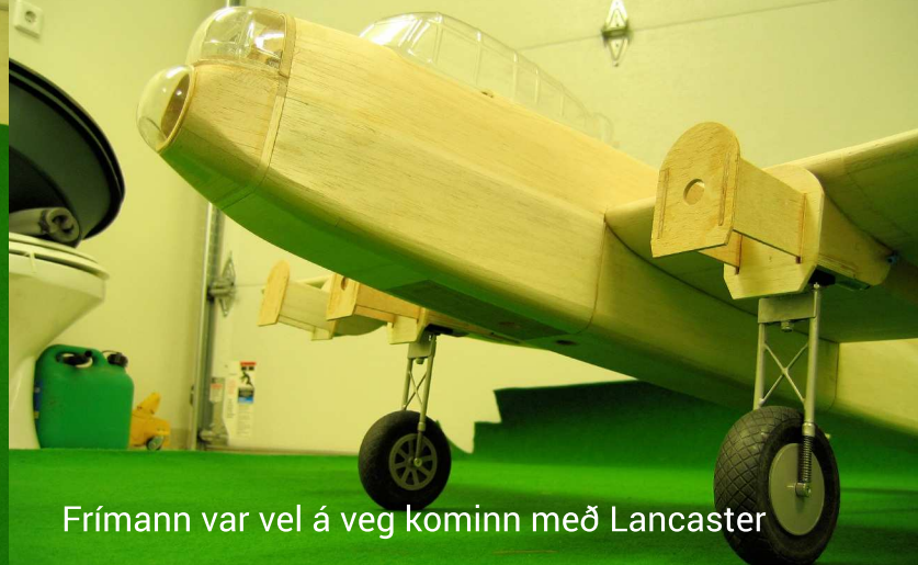
Frímann var vel á veg kominn með Lancaster