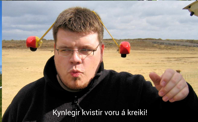
Kynlegir kvistir voru á kreiki!