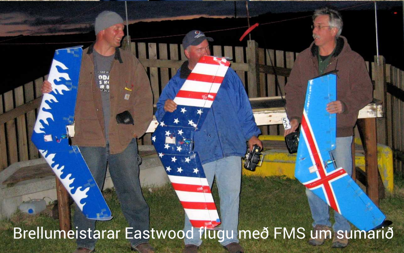
Brellumeistarar Eastwood flugu með FMS um sumarið