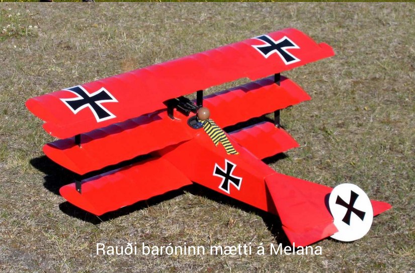
Rauði baróninn mætti á Melana