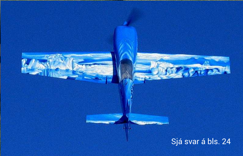
Sjá svar á bls. 24