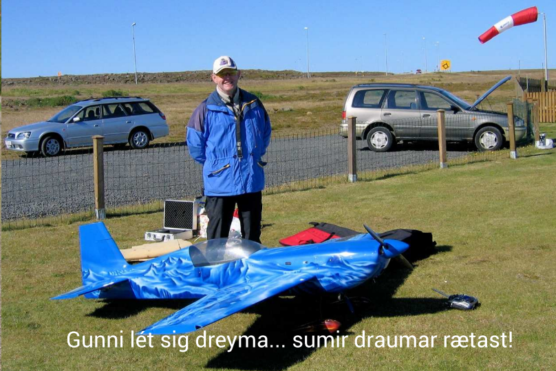
Gunni lét sig dreyma... sumir draumar rætast!