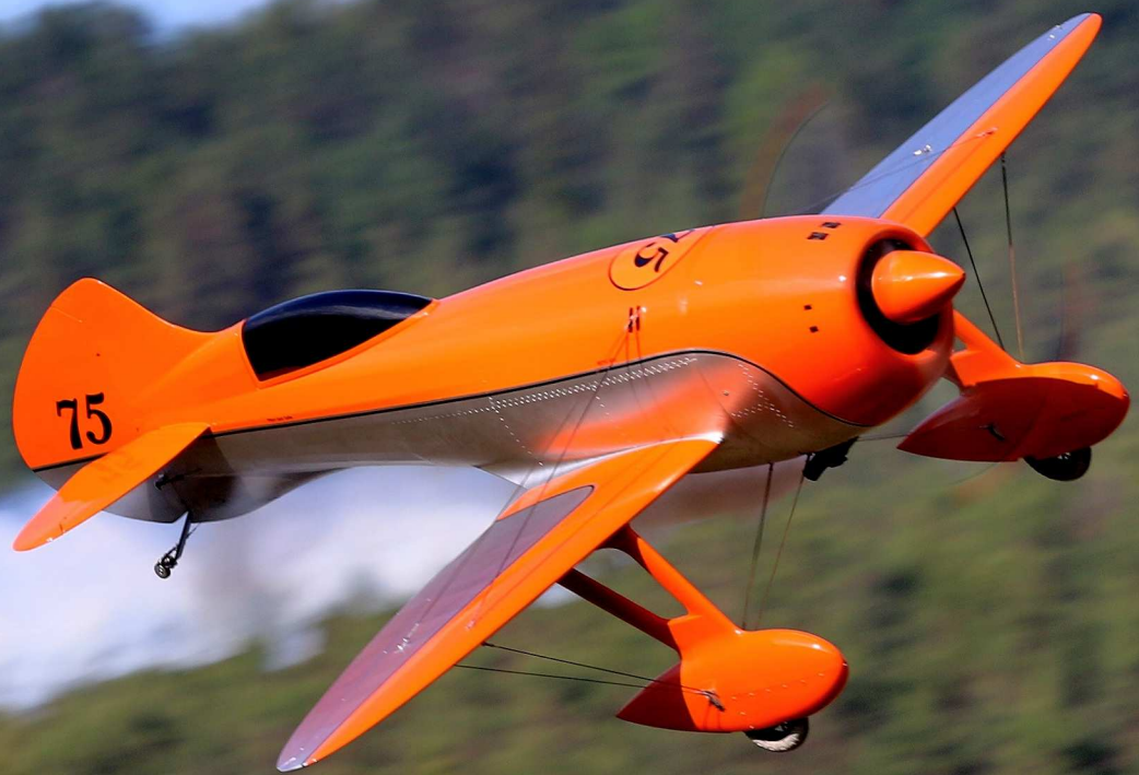
Gee Bee R3, hvað ef... útgáfa frá CARF