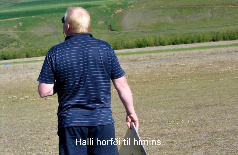
Halli horfði til himins