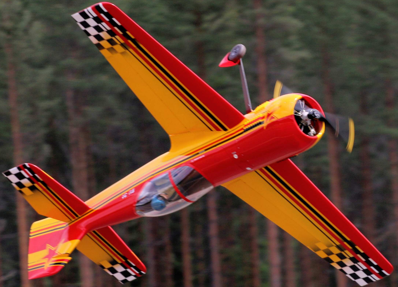
38% Su-31 frá CARF með Moki 215(cc) stjörnumótor