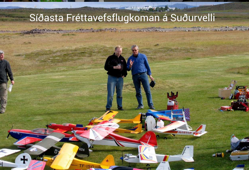
Síðasta Fréttavefsflugkoman á Suðurvelli