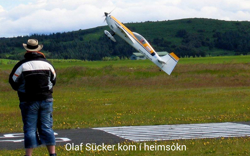
Olaf Sücker kom í heimsókn