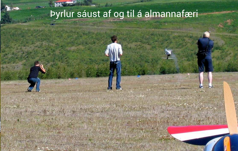
Þyrlur sáust af og til á almannafæri