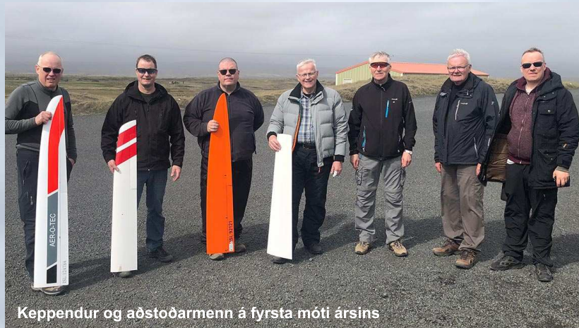
Keppendur og aðstoðarmenn á fyrsta móti ársins

Hér á opnunni má sjá svipmyndir frá mótunum.