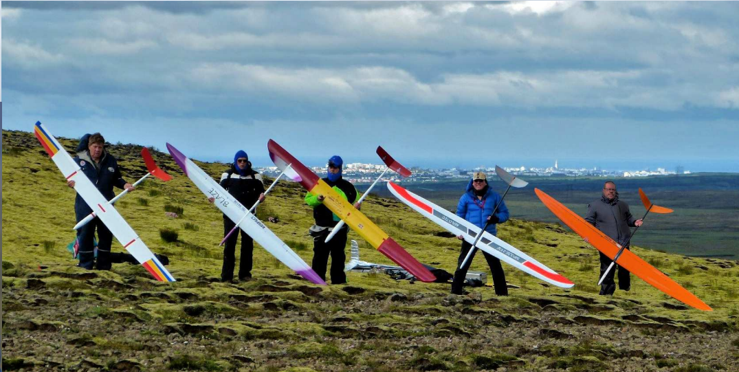
Fríður hópur keppenda á öðru móti ársins