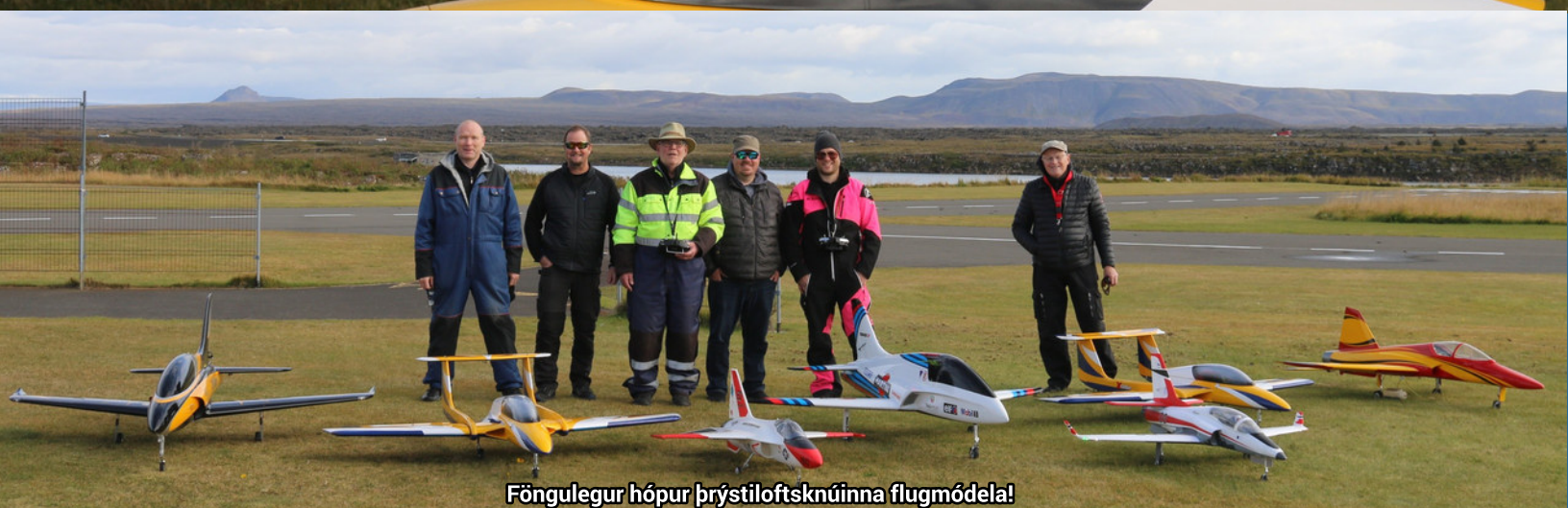
Föngulegur hópur þrýstiloftsknúinna flugmóðela!