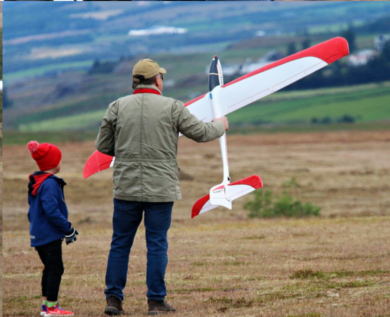
Hvað ungur nemur, gamall temur!