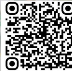
Vídeo á YouTube