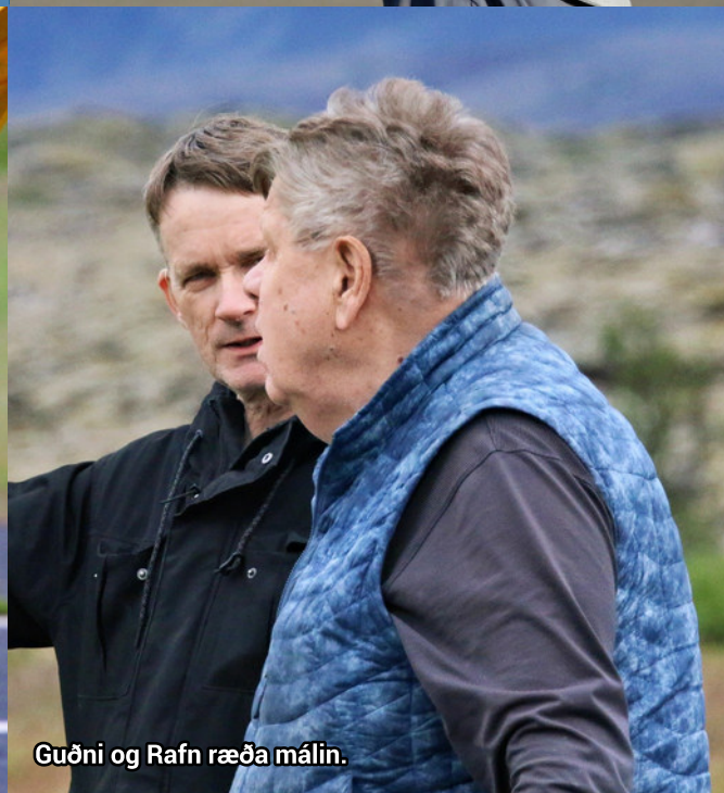
Guðni og Rafn ræða málin.