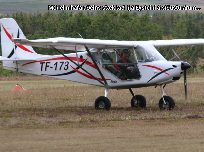
Módelin hafa aðeins stækkað hjá Eysteini á síðustu árum...