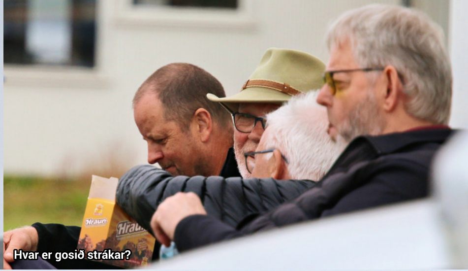
Hvar er gosið strákar?