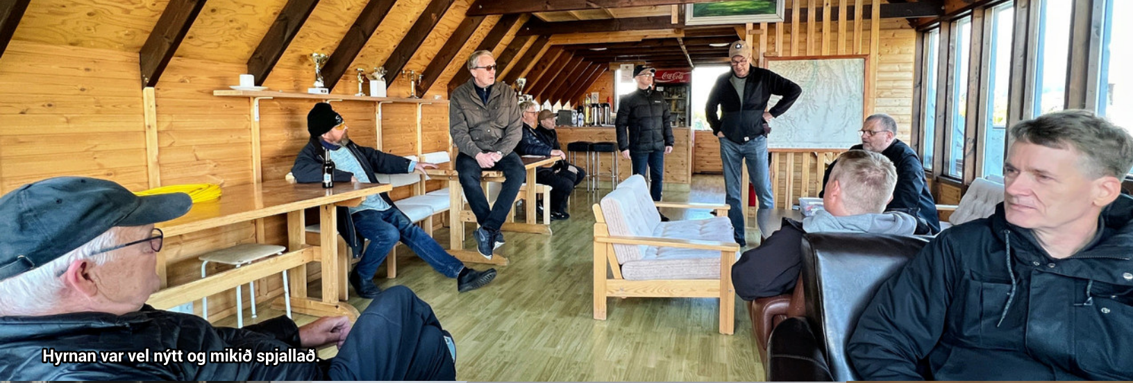
Hyrnan var vel nýtt og mikið spjallað.