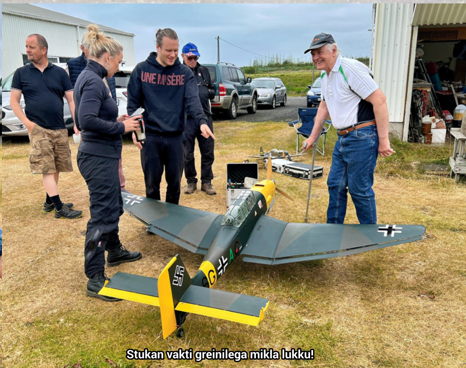
Stukan vakti greinilega mikla lúkku!