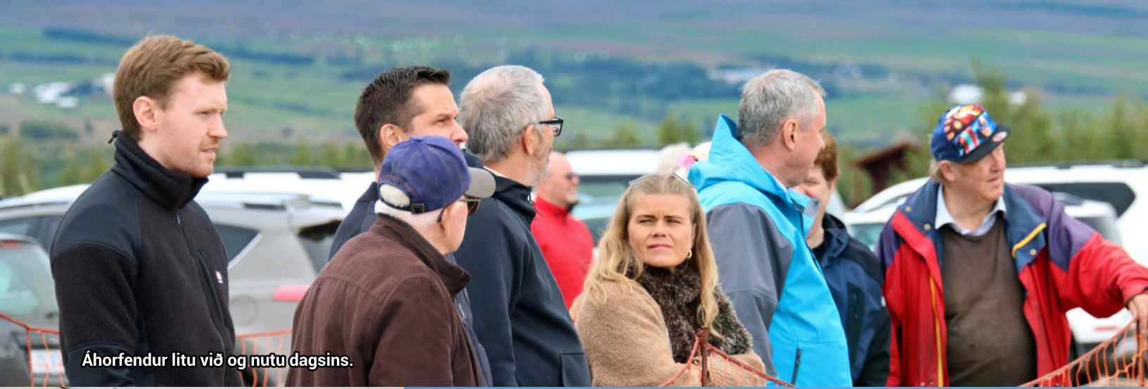
Áhorfendur litu við og nutu dagsins.