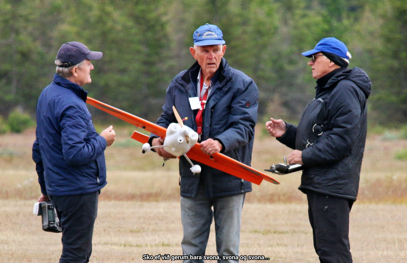
Sko ef við gerum bara svona, svona og svona...