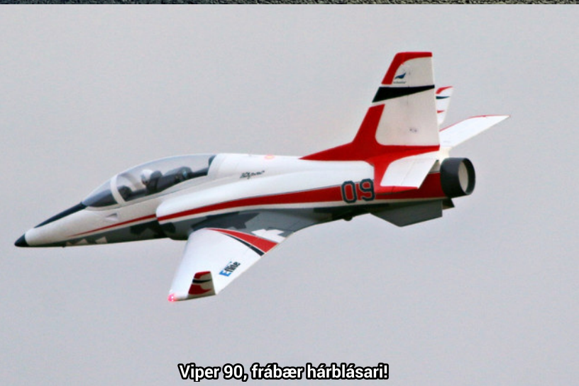
Viper 90, frábær hárbílastari!