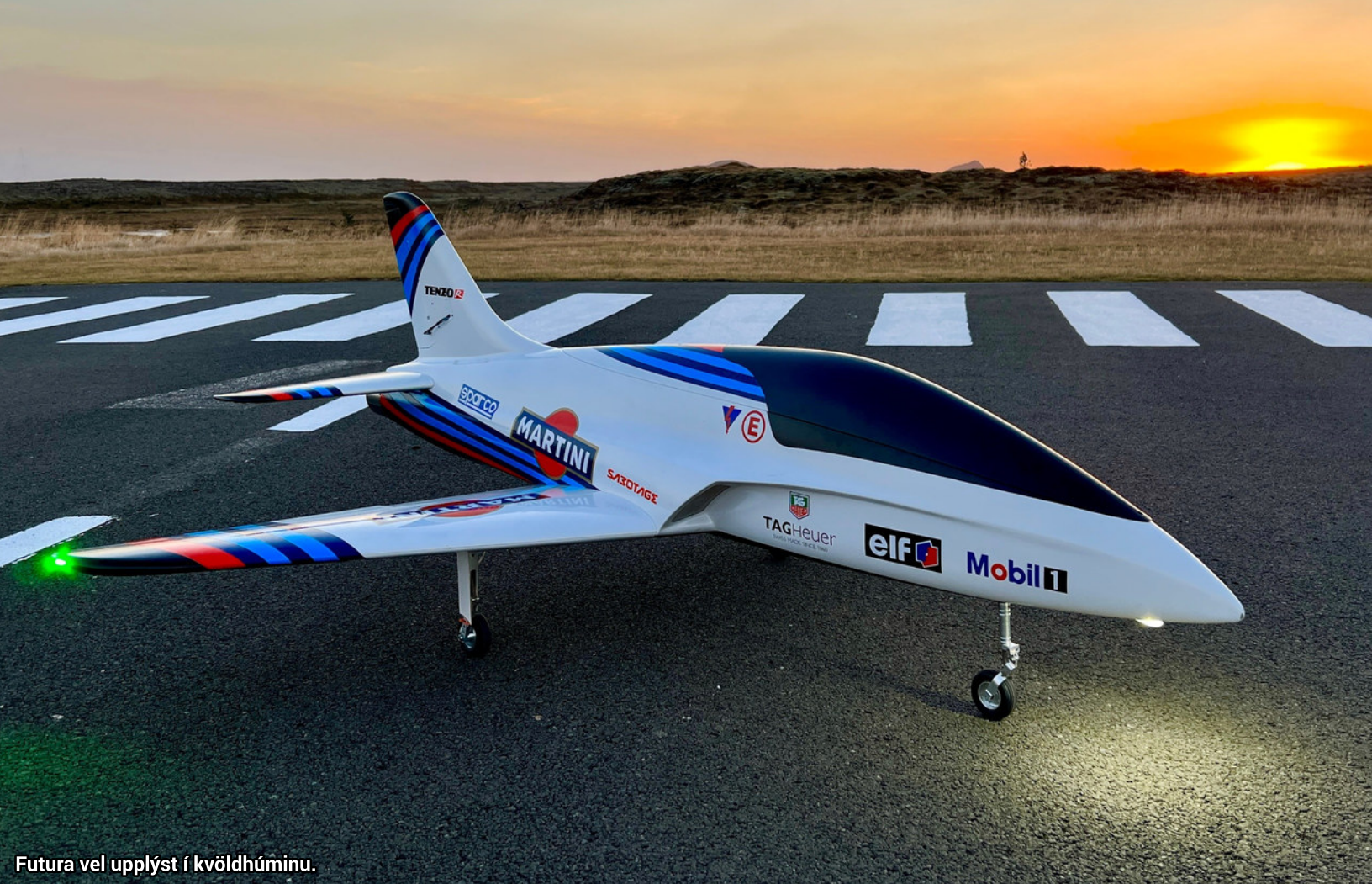
Futura vel upplýst í kvöldhúminu.