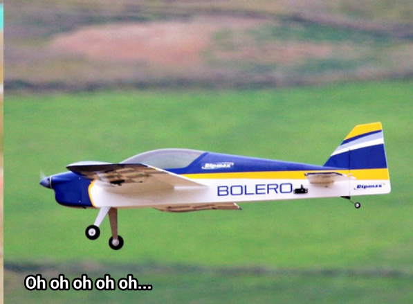
Oh oh oh oh oh...