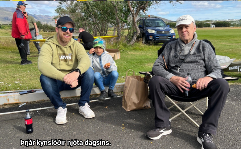
Þrjár kynslóðir njóta dagsins.