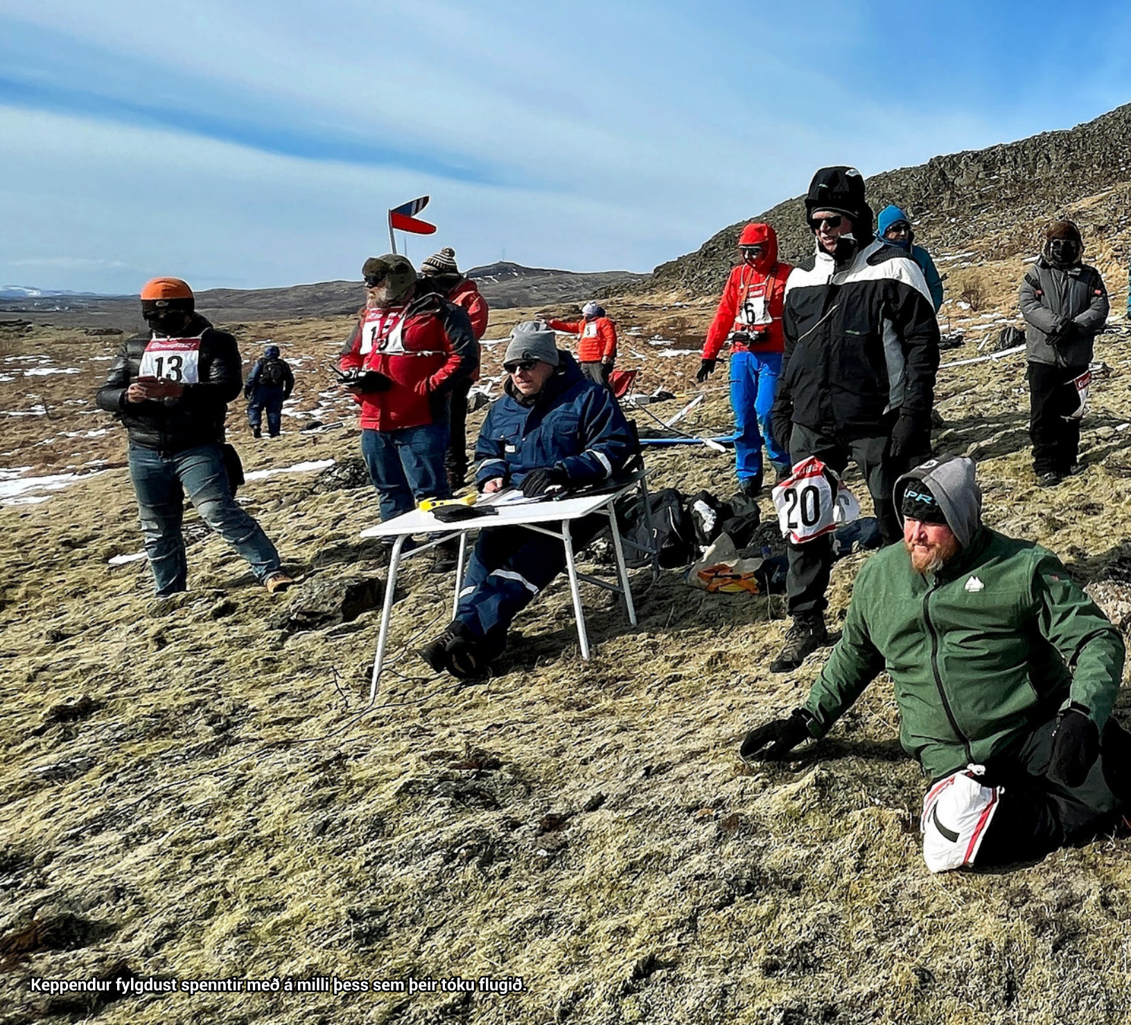
Keppendur fylgdust spennir með á milli þess sem þeir tóku flugið.