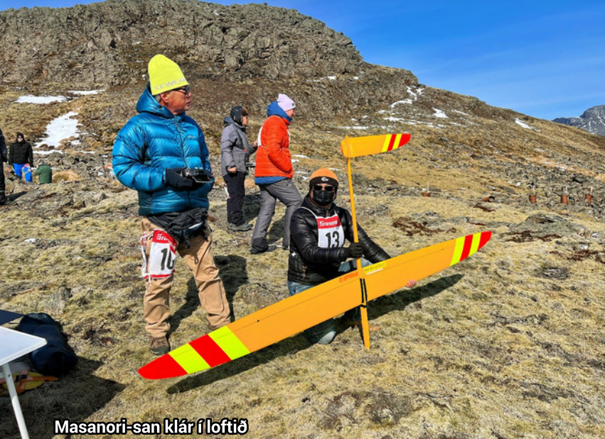
Masanori-san klár í loftið