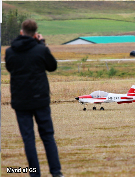
Mynd af GS