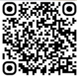
Umfjöllun frá 13. júní