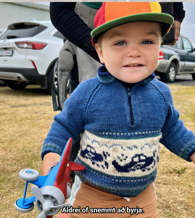
Aldrei of snemmt að byrja.