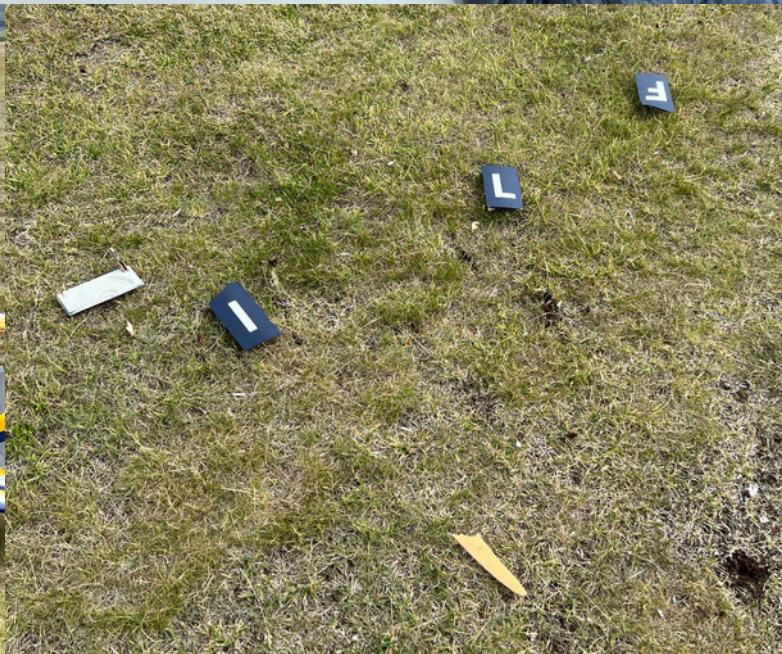
Voru einhverjir að spila Scrabble?