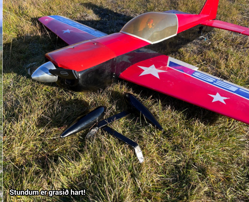
Stundum er grasið hart!