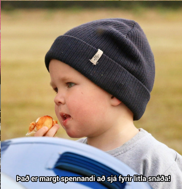
Það er margt spennandi að sjá fyrir litla snáða!