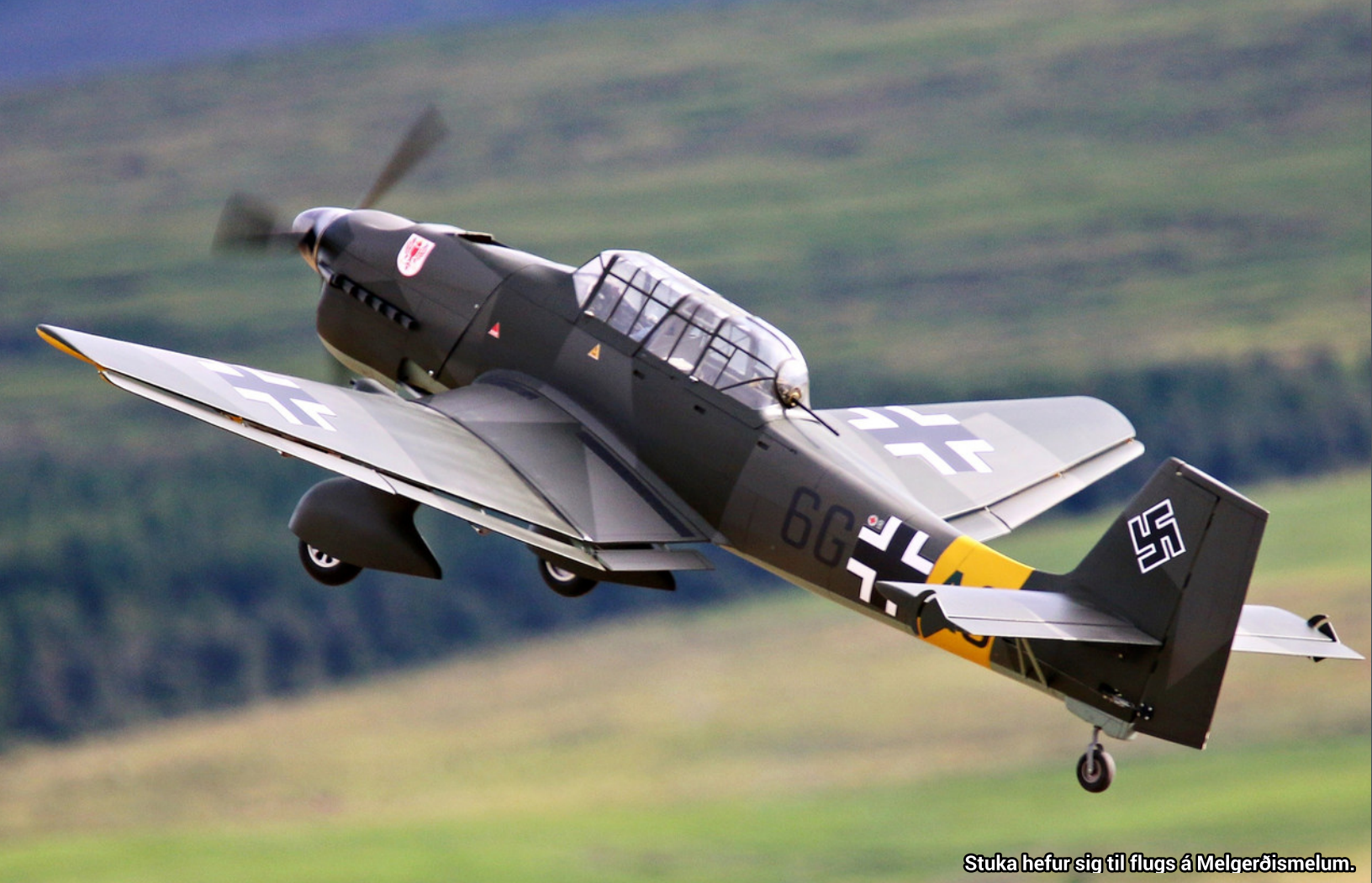
Stuka hefur sig til flugs á Melgerðismelum.