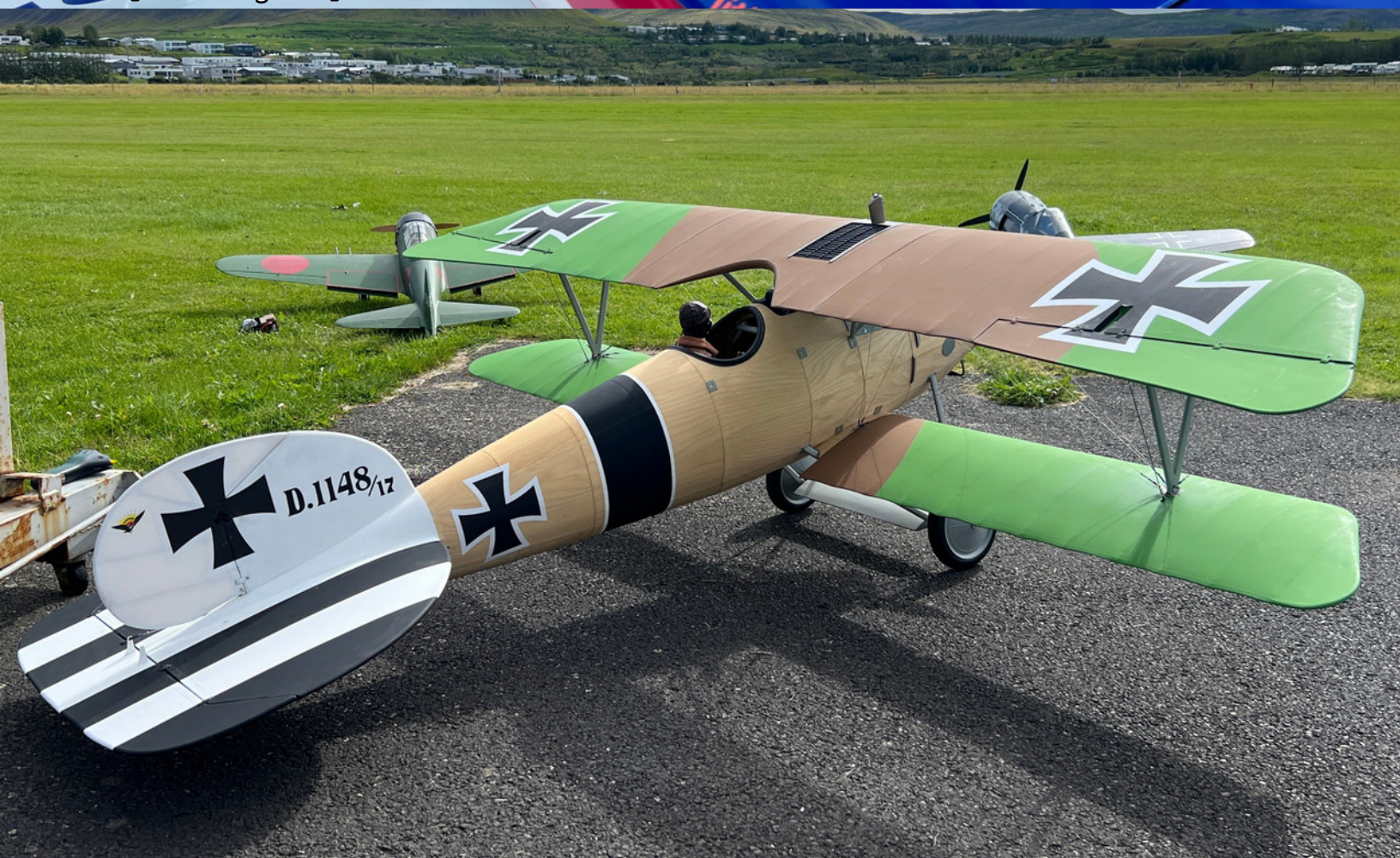
Falleg smíði úr smíðju Skjaldar Sigurðssonar.