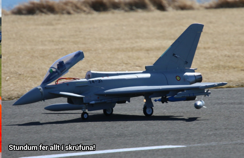
Stundum fer allt í skrófuna!