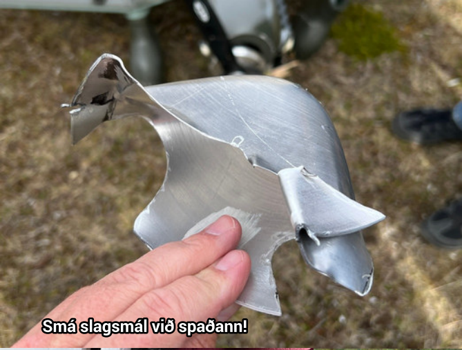
Smá slagsmál við spaðann!