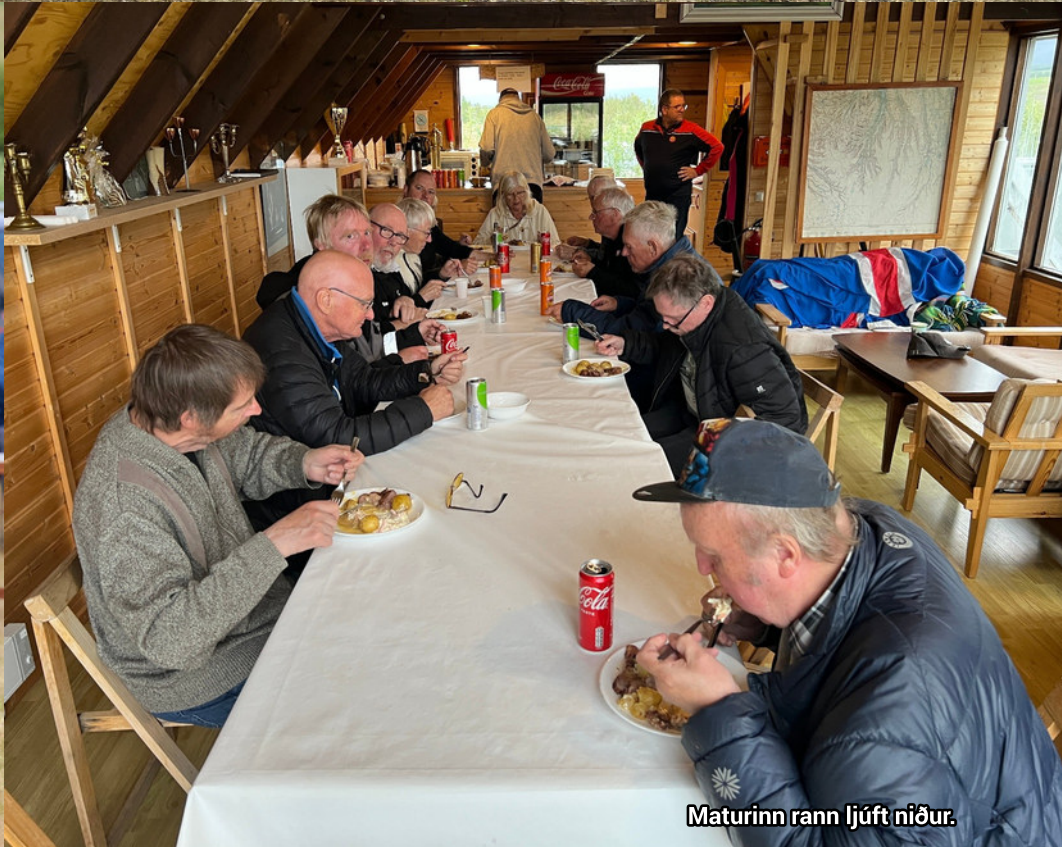
Maturinn rann ljúft niður.