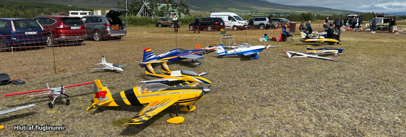
Hluti af fluginunni.